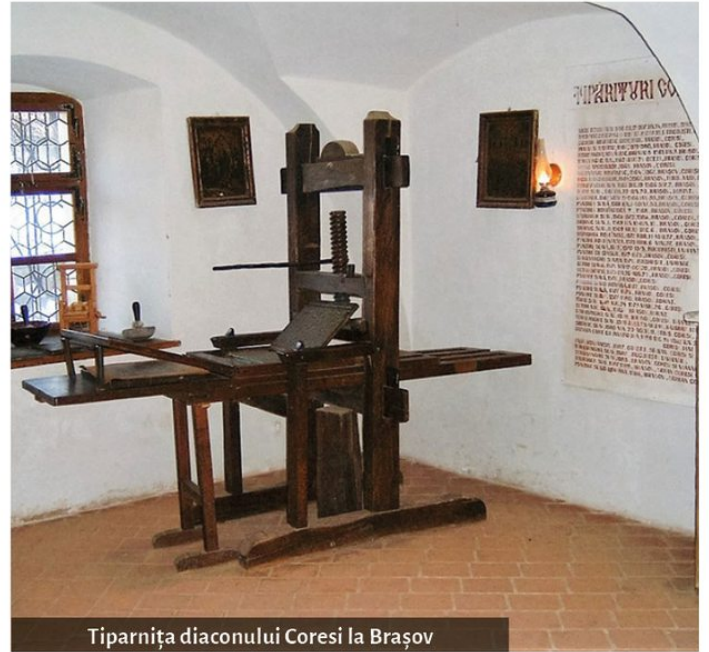
Tiparnița diaconului Coresi la Brașov

În sfârșit, să reluăm ideea de mai sus: creațiile spirituale ale poporului român devin „naționale” când are deja o limbă literară proprie și este conștient de valorile sale identitare. Primii reprezentanți de seamă ai culturii naționale, ai literaturii și ai științei românești moderne în curs de formare sunt Varlaam, Simion Ștefan, Dosoftei, Grigore Ureche, Miron Costin, Constantin Cantacuzino, Ion Neculce și Dimitrie Cantemir. Ei constituie întâia generație de cărturari români. Ei sunt primii care știu deja să scrie într-o limbă română mai aleasă, de fapt făuritorii ei. Tot ei sunt cei care ne dau primele pagini de proză artistică inspirându-se din poezia populară, punând-o la temelia literaturii culte. Primul monument al literaturii culte și naționale al românilor este „Psaltirea în versuri” a lui Dosoftei (1624-1693), tipărită în 1673, în Polonia. Procesul de „naționalizare” a culturii și literaturii române, început de acești cărturari în secolul al XVII-lea, iese biruitor în a doua parte a secolului al XVIII-lea și prima jumătate a secolului al XIX-lea, odată cu trezirea la conștiință națională și începerea luptei pentru